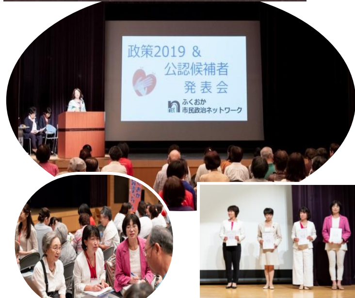
参加者の感想から

政策は、どれも女性ならではの視点で捉えられたものばかりで、思わず「そうそう」と頷いていました。近年女性の社会進出が進み、「イクメン」と呼ばれる育児参加の父親や主夫等も増えてきています。しかし、まだまだ家庭の仕事の殆どは、多くの女性たちが担っているのが現状です。