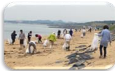
2019年 ラブアースクリーンアップ