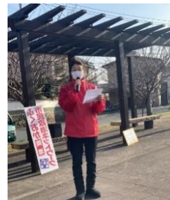
やっばあ〜岡垣前で 議会報告