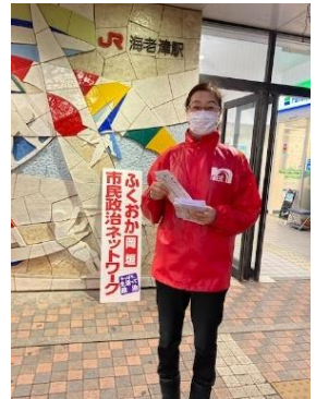
海老津駅前にて ネットニュースを配布しました