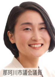
那珂川市議会議員